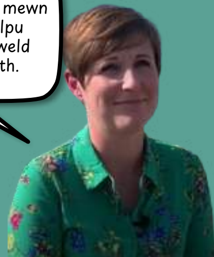
Ceri Rhiannon Gweithiwr Cymdeithasol

Mae'r teimlad rwyf ti yn cael o weithio hefo pobl yn lot fwy gwerthfawr na phres.